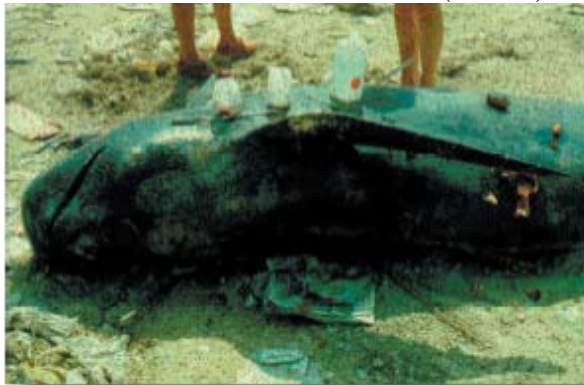
© Toni Raga - Univ. Valencia

Un morceau de peau (2 x 2 cm) doit être prélevé et conservé à l'état congelé ( -20^{\circ}\text{C} ) ou fixé soit dans un éthanol à 70% soit dans une solution (DMSO) à 20% de diméthyl sulfoxyde saturée au NaCl.